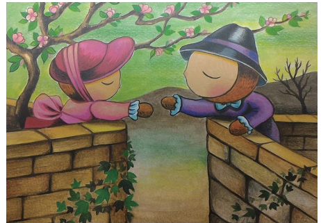
協會與插畫家眼球先生合作推出明信片