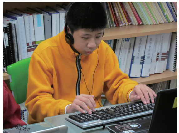
協會提供豐富課程與技職訓練

案也將重心轉為教育層面。聯合勸募協助協會成立點譯部門，製作點字書及觸摸地圖等教具之外，也協力視障生的課後輔導服務。