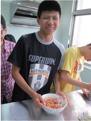
樂觀正向的視障生豪社