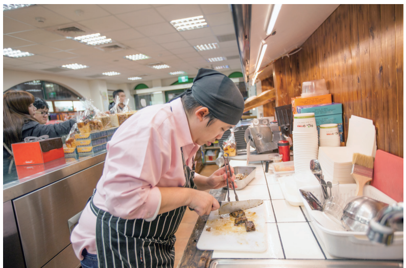
智青員工為顧客細心切滷味