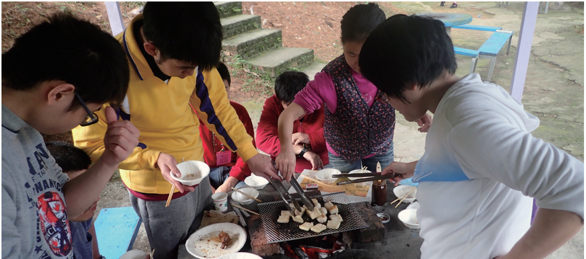
友誼社歡樂烤肉行！