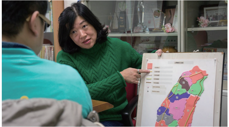
協會開發觸摸地圖協助視障生認識地理