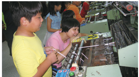
傷友從事多元就業活動