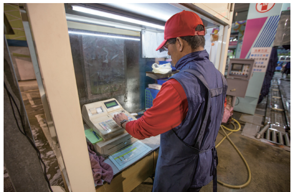
負責洗車場收銀的智青

創建制度對社員來說，是不容易且辛苦的一步，首先是不同意見的妥協，其次是遵守規則的責任感。然而，辛苦是值得的，社員從過程