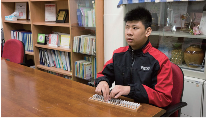
豪祚在協會的課輔班學會珠心算