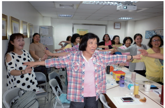
透過困境團體課程，協助病友自我接納