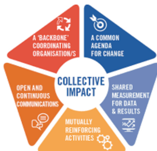
圖片來自澳洲聯合勸募

「集合影響力」自2011年於《史丹佛社會創新評論》期刊暨網站（Stanford Social Innovation Review）發表同名文章迄今，已被美、加、澳等國之公、私及第三部門用來做為解決大規模社會問題的有力途徑之一。